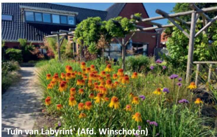
'Tuin van Labyrint' (Afd. Winschoten)