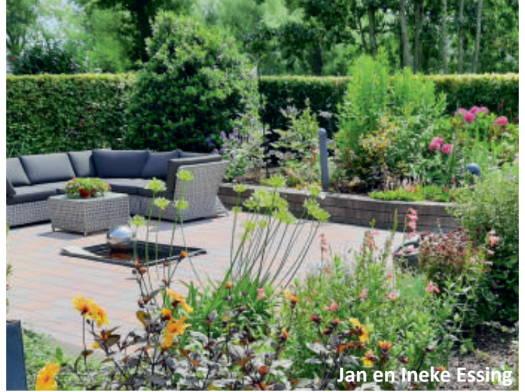
Jan en Ineke Essing

Onze tuin is ongeveer 1000 m 2 groot, aan de rand van de stad. Beukenhagen delen de tuin in onderdelen met elk een eigen sfeer. Er is zes jaar geleden begonnen met een uitgewerkt beplantingsplan, maar gaandeweg is er impulsief getuinierd. Altijd in beweging!