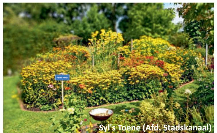
Syl's Toene (Afd. Stadskanaal)