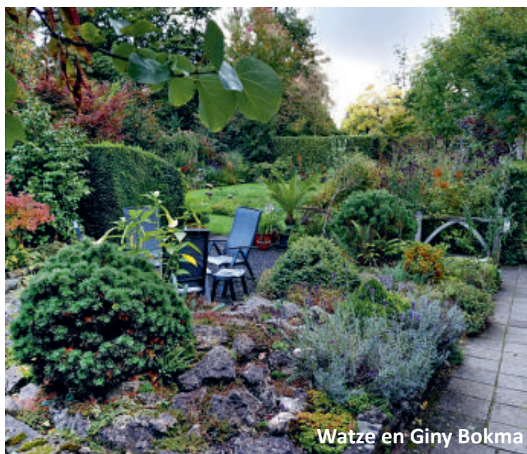
Watze en Giny Bokma