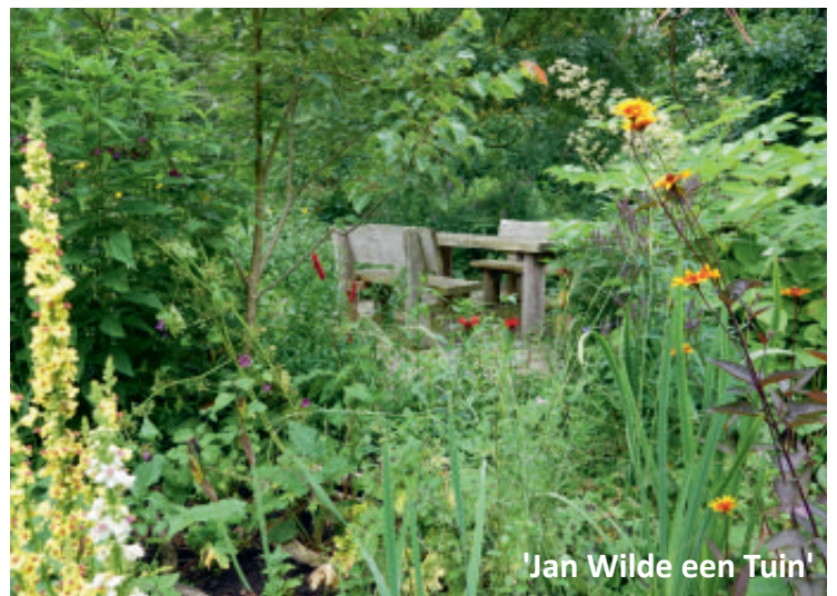
'Jan Wilde een Tuin'