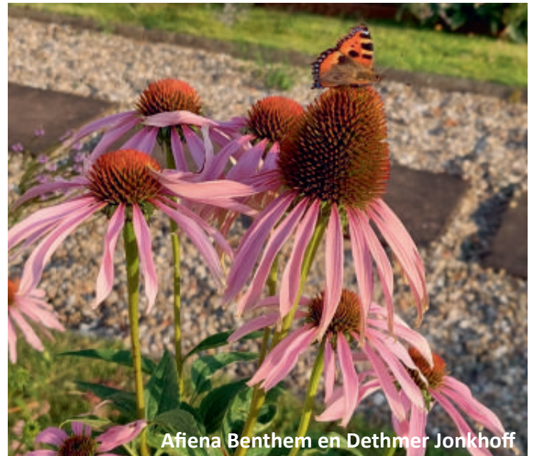
Afien Benthem en Dethmer Jonkhoff

Een sfeervolle zelf ontworpen wandeltuin. Via de voortuin langs de moestuin naar de achtertuin met terrasjes, met bloemen rondom het gazon, een kas, verschillende fruitsoorten, groenten en kruiden bij het water.