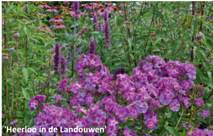
'Heerloo in de Landouwen'

Het is een zonnige tuin van ongeveer 1000 m2 met veel planten in pot. De tuin is in het voorjaar van 2017 ontstaan en door de jaren heen heel erg veranderd. Er is een moestuin en een vijver voor de beestjes. Gewoon een gezellige tuin.