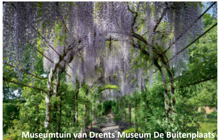
Museumtuin van Drents Museum De Buitenplaats

Een tuin met veel inheemse struiken en bloemen, fruitbomen en bessenstruiken. In de border staan vele verschillende geraniumsoorten. Het is een mooie uitdaging deze tuin in evenwicht te houden.