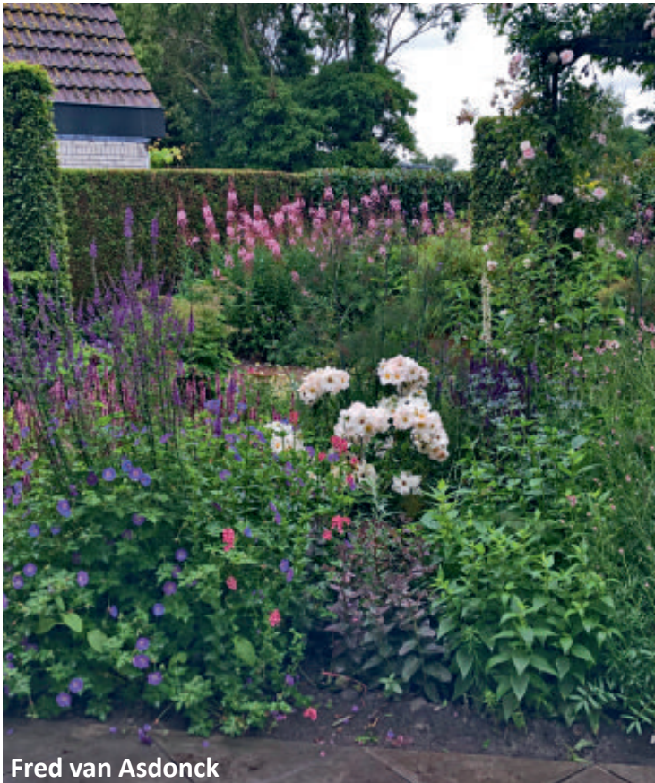
Fred van Asdonck

Tuin 2000 m 2 ligt aan het water en riet van een natuurgebied van Natuurmonumenten. Bij het huis houten vlonders met subtropische planten, borders met lavendel, rozen, prairieplanten, 2 kassen en groentetuin. Niet geschikt voor rolstoelen.